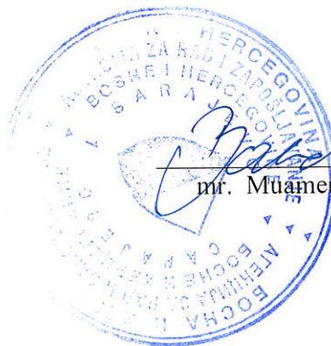
mr. Muamer Bandić

Plan nabavke opreme je: kancelarijske stolice (11 stolica x 310,00 KM = 3.410,00 KM) i kopir aparat vrijednosti 4.590,00 KM, koji su neophodni zbog tehničke neispravnosti i dotrajalosti postojeće opreme.